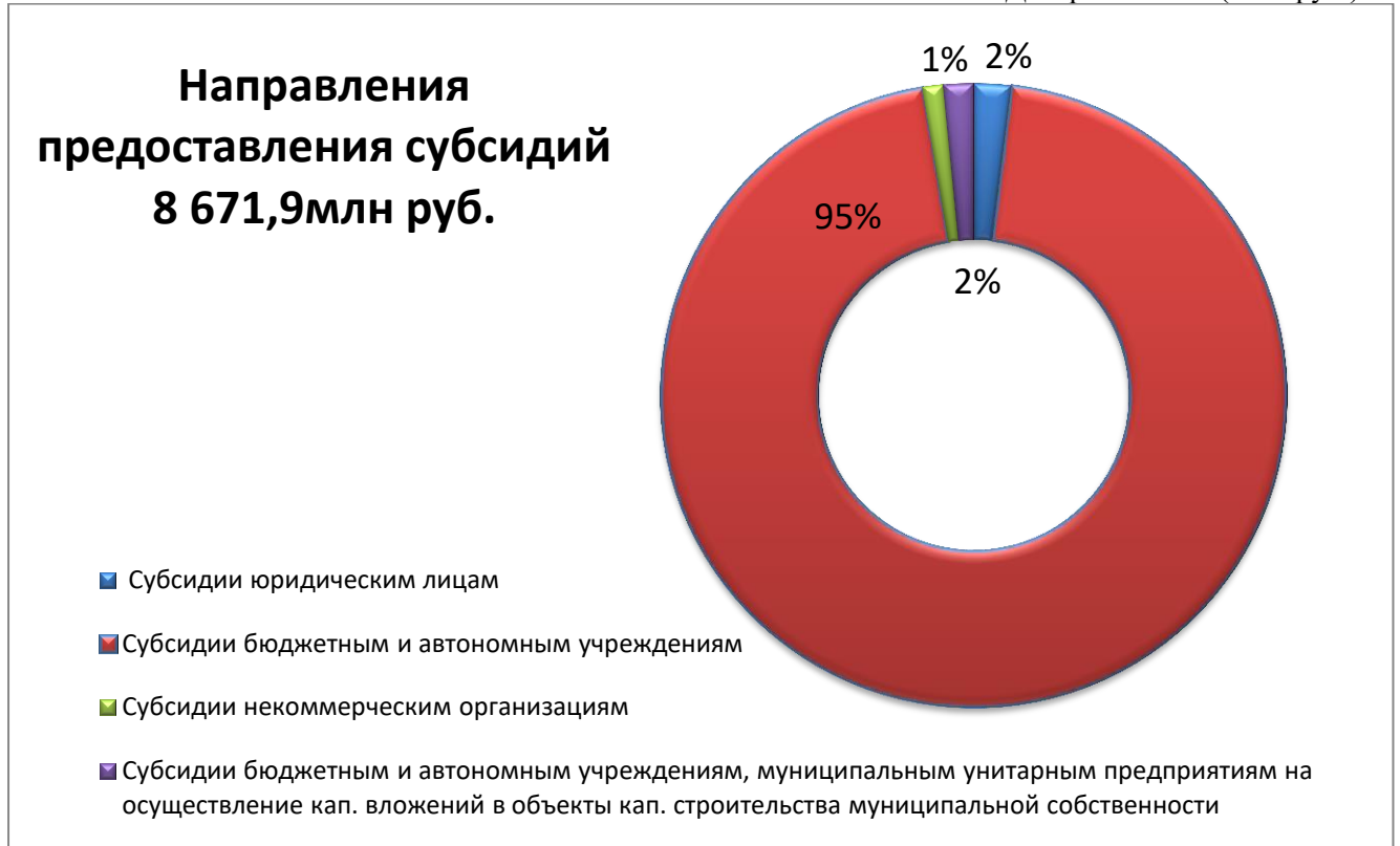
Диаграмма № 2 (млн. руб.)

В общем объеме предоставленных в 2024 году субсидий наибольший удельный вес в размере 95% или 8 276,3 млн. руб. сложился по субсидиям бюджетным и автономным учреждениям, в том числе: